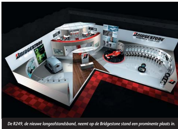
De R249, de nieuwe langeafstandsband, neemt op de Bridgestone stand een prominente plaats in.

Bridgestone zal daarom vertegenwoordigd zijn met een stand die geheel voor deze gelegenheid werd vernieuwd. Behalve de producten zullen alle beschikbare wagenparkdiensten worden getoond en uitgelegd.