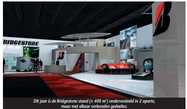
Dit jaar is de Bridgestone stand (± 400 m 2 ) onderverdeeld in 2 aparte, maar met elkaar verbonden gedeeltes.

Vergeleken met voorgaande shows heeft Bridgestone echter gekozen voor een nieuwe aanpak wat betreft service. In feite is een groot gedeelte van de stand (1/3 van het totale oppervlak) ingeruimd voor de beschikbare diensten. Om zaken voor de bezoeker te verduidelijken, heeft Bridgestone de beschikbare diensten gestructureerd en een geïntegreerd communicatieplatform ontwikkeld. Daarom zal het alomvattende concept "Totaal wagenparkbeheer", dat officieel in de BedrijfsautoRAI wordt gelanceerd, vanaf nu bestaan uit vier afzonderlijke diensten, die elk kunnen worden aangepast aan de eisen van de klant. Deze nieuwe beschrijving van de diensten vormt het hart van een