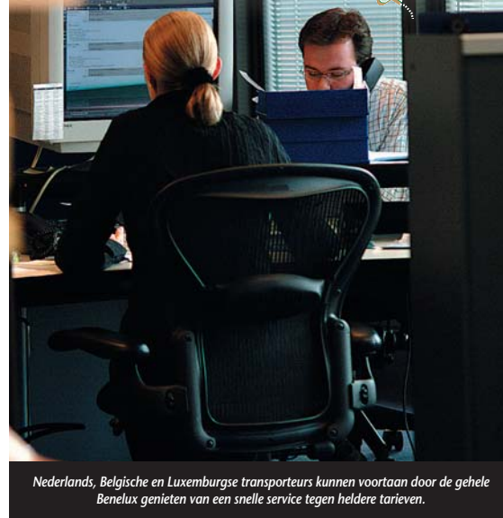
Nederlands, Belgische en Luxemburgse transporteurs kunnen voortaan door de gehele Benelux genieten van een snelle service tegen heldere tarieven.