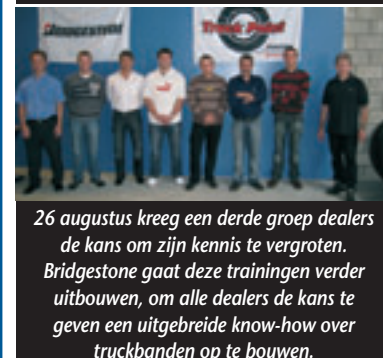
26 augustus kreeg een derde groep dealers de kans om zijn kennis te vergroten. Bridgestone gaat deze trainingen verder uitbouwen, om alle dealers de kans te geven een uitgebreide know-how over truckbanden op te bouwen.