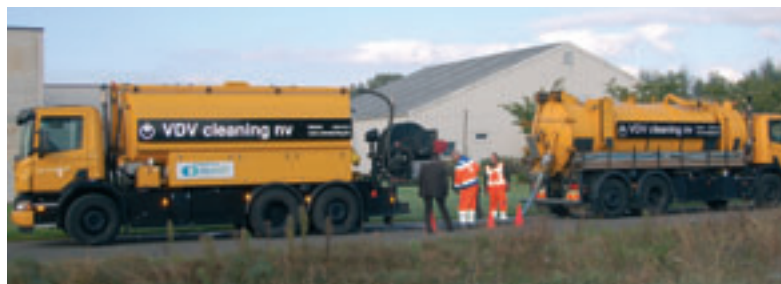
Bridgestone/Firestone is een partner die de nodige tools te beschikking stelt om het logistieke gebeuren van de bedrijfsactiviteiten te optimaliseren.