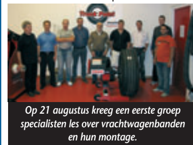
Op 21 augustus kreeg een eerste groep specialisten les over vrachtwagenbanden en hun montage.

Bridgestone biedt de dealers via deze trainingen, die door onafhankelijke specialisten worden gegeven, de kans om echte specialisten te worden op het vlak van vrachtwagenbanden. Vrachtwagenbanden vormen immers een veel veeleisender en ingewikkelder product dan personenwagenbanden. Door een degelijke training kan de Truck Point dealer de nodige en actuele kennis opbouwen om een transportondernemer op een correcte manier te helpen.