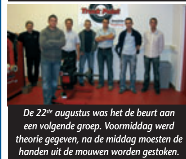
De 22 ste augustus was het de beurt aan een volgende groep. Voormiddag werd theorie gegeven, na de middag moesten de handen uit de mouwen worden gestoken.