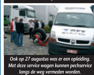
Ook op 27 augustus was er een opleiding. Met deze service wagen kunnen pechservice langs de weg vermeden worden.